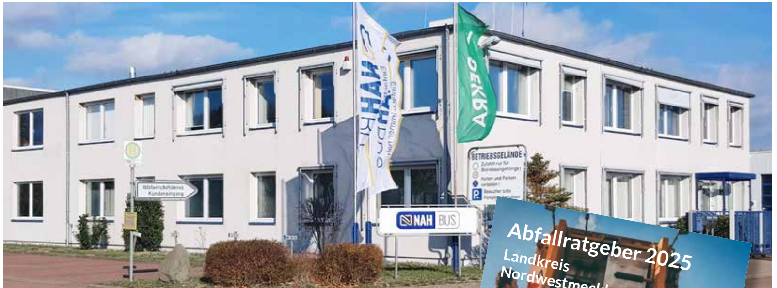
Der Abfallwirtschaftsbetrieb des Landkreises Nordwestmecklenburg.

Ab sofort steht Bürgerinnen und Bürgern der neue Abfallratgeber für den Landkreis zur Verfügung. Dieser ist bereits an alle Haushalte im Landkreis Nordwestmecklenburg verteilt. Sollte es hier Probleme bei der Zustellung gegeben haben: Auch in den beiden Bürgerbüros in Wismar und Grevesmühlen sowie in den Amtsverwaltungen liegen Exemplare des Abfallratgebers aus.