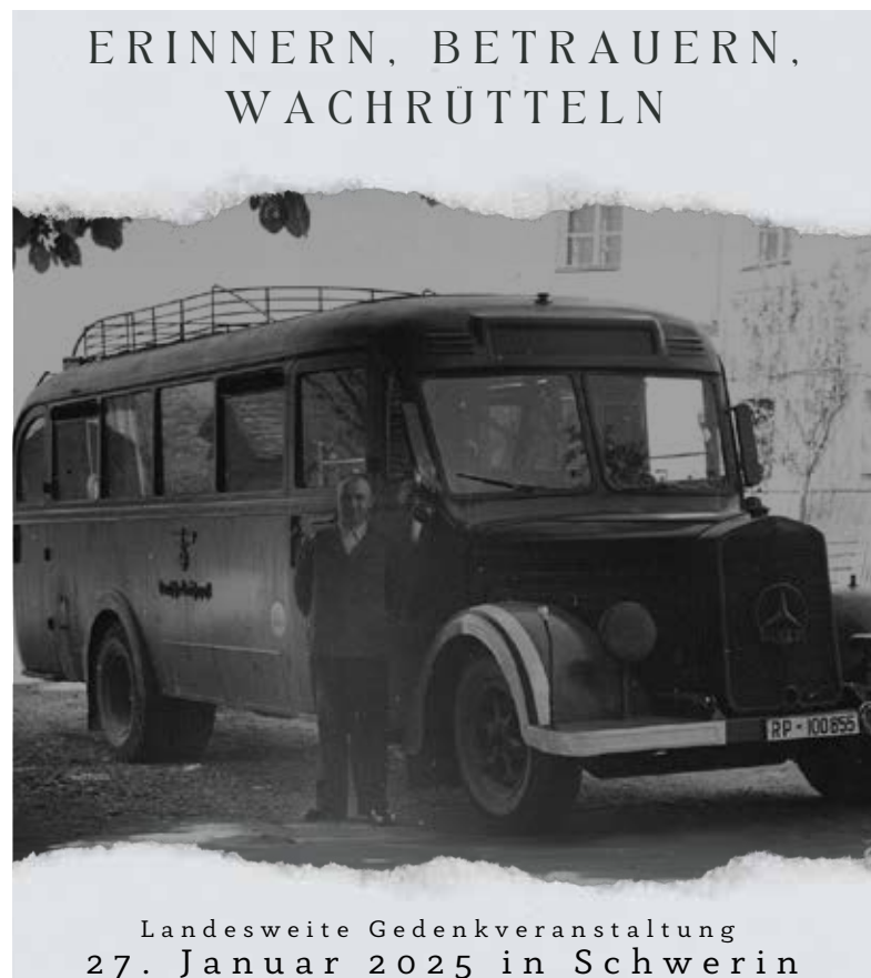
Landesweite Gedenkveranstaltung 27. Januar 2025 in Schwerin

https://sozialpsychiatrie-mv.de/ gibt es weitere Informationen. Der Landesverband Psychosozialer Hilfsvereine Mecklenburg-Vorpommern e.V. verfolgt das Ziel, diese Träger und Institutionen zur gegenseitigen Förderung, Repräsentation und gemeinsamen Interessenvertretungen zusammenzuschließen und sich an der Weiterentwicklung der psychiatrischen Versorgung im Land Mecklenburg-Vorpommern zu beteiligen. Er setzt sich ein für eine gemeindepsychiatrische und an der Person des Einzelnen orientierten Versorgung von Menschen mit psychischen Erkrankungen und Behinderungen sowie von Chronifizierung bedrohter Menschen und damit für eine dauerhafte soziale Integration und gleichberechtigte gesellschaftliche Teilhabe.