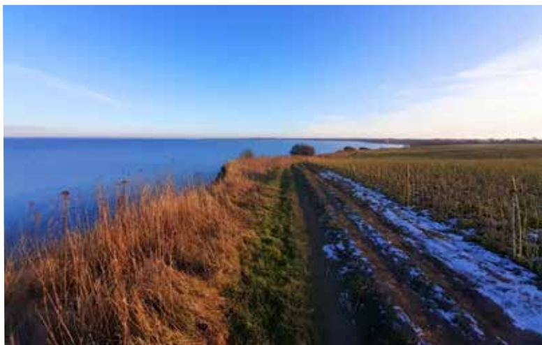
Ramona Schult • Winterspaziergang über Feld und Wiese in Redewisch mit Blick auf die Ostsee