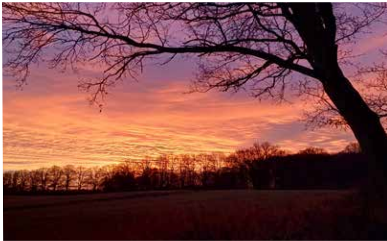
Marion Böttcher • Sonnenaufgang in Dechow

Mit dem Einsenden von Fotos bestätigen Sie, dass Sie der Urheber des eingesandten Materials sind, keine Persönlichkeitsrechte Dritter verletzt werden und stimmen ausdrücklich einer unentgeltlichen Nutzung für alle Verwendungszwecke durch den Landkreis Nordwestmecklenburg zu.