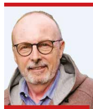
Autor: Rainer Polzer

Zahlreiche exklusive Dokumente und Fotos machen es zudem zu einem außergewöhnlichen Zeitdokument.