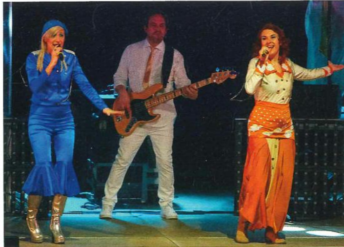
„Agnetha“ und „Anni-Frid“ in Aktion. Die beiden Italienerinnen kommen stimmlich ihren schwedischen Vorbildern recht nahe.

Mit mehr als 350 Millionen verkauften Alben weltweit gehört